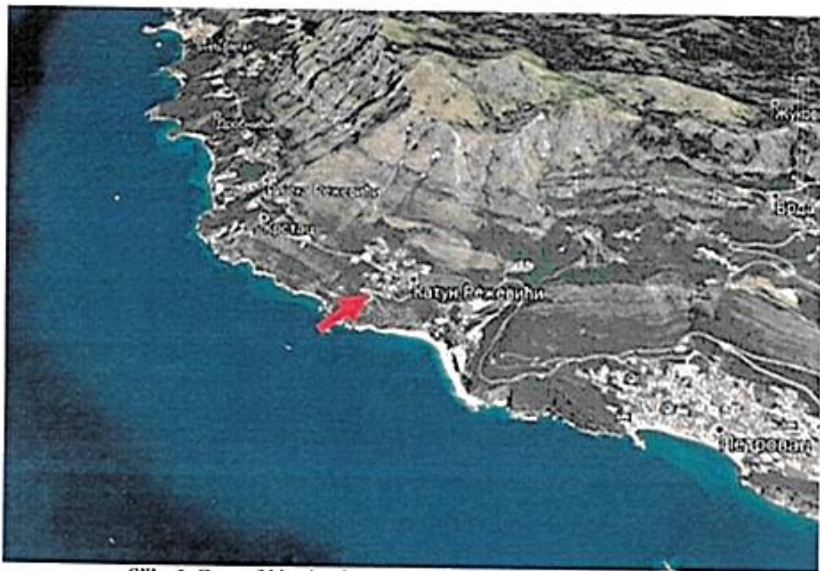
Slika 1. Geografski položaj lokacije saobraćajnica (označen strelicom)

Teren lokacije je površina obrasla niskim rastinjem. Lokacija je u nagibu prema moru sa izraženim padom neposredno uz obalu i na granici zone zahvata u pravcu sjeverozapad-sjeveroistok.